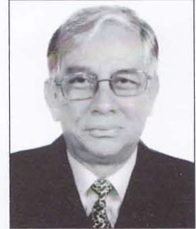
President, Board of Trustees Founder Vice Chancellor Founder President, Board of Directors East West University